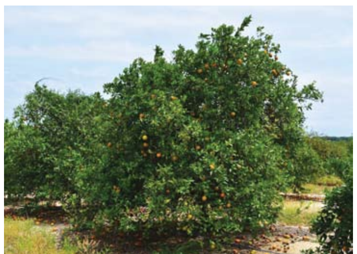
Planta adyacente sin Root Guard