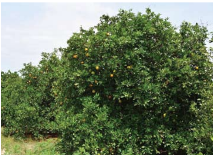
Planta de Cítrica con Root Guard

Root Guard está disponible ya en Agro Servicios, Inc. Procúralo, pregunta, úsalo y convéncete de su efectividad.