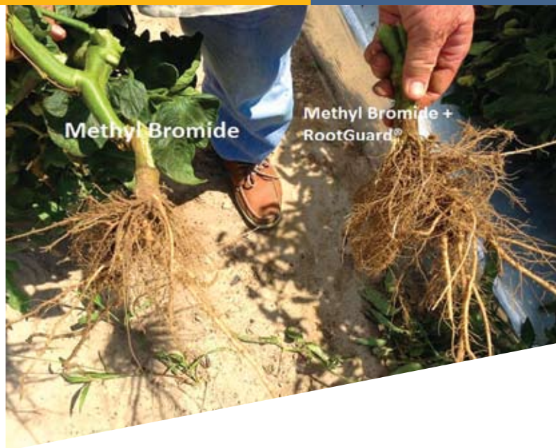
Cosecha de tomates en primavera, Carolina del Sur, USA.

El aumento en la producción de la enzima quitinasa en el suelo nos lleva a una degradación de la pared celular de los nematodos parásitos de plantas, huevos de nematodos y hongos.